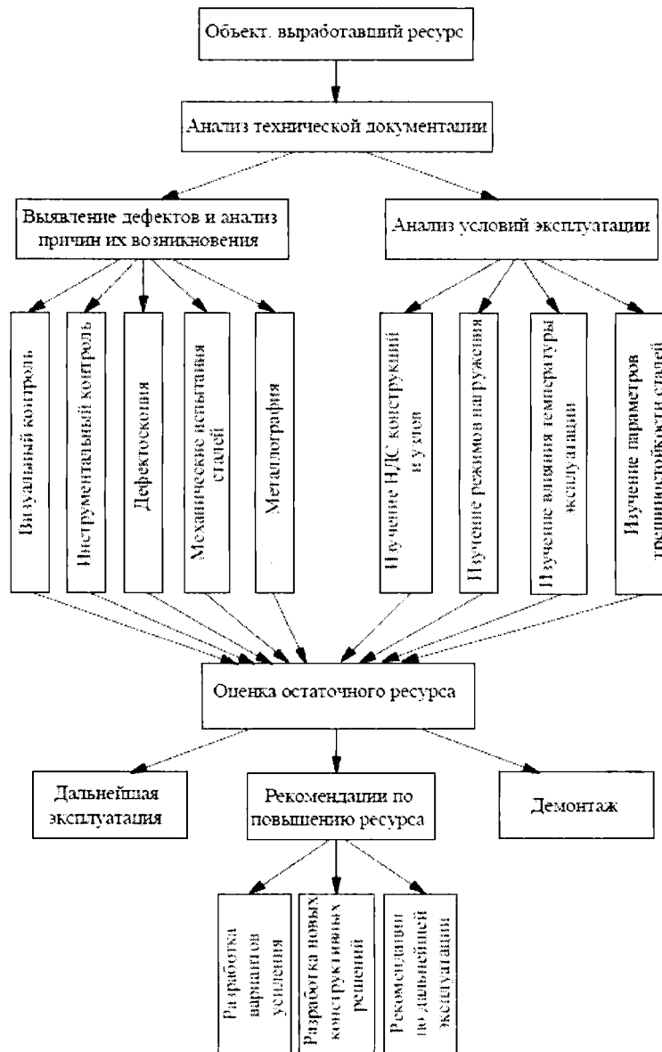
Рис. 1. Алгоритм оценки остаточного ресурса строительных конструкций объектов использования атомной энергии

138. Основные этапы процесса определения остаточного ресурса ОИАЭ показаны на структурной схеме (рис. 1).